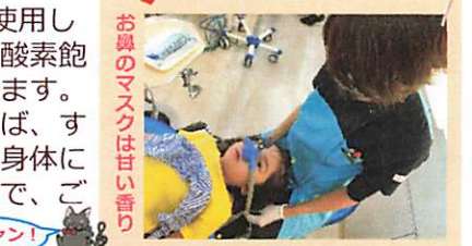
お鼻のマスクは甘い香り

使用中はSPO2モニターを使用して、脈拍数と経皮的動脈血酸素飽和度心拍数も計測しております。治療が終わって酸素を吸えば、すぐに元の状態に戻ります。身体には全く影響がありませんので、ご安心してください。大丈夫ニヤン！